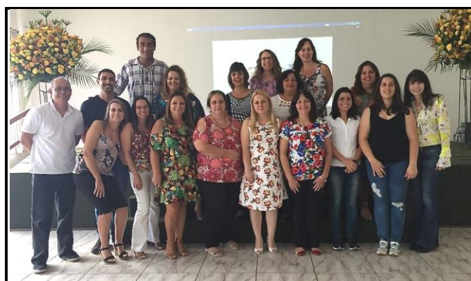
Equipe gestora envolvida no encontro