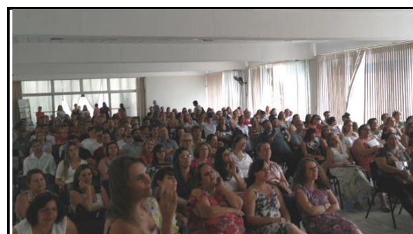
Equipe de professores que lecionam nas escolas estaduais de Espírito Santo do Pinhal